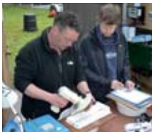
(G-D) Les tacons sont pesés, mesurés et équipés de marques individuelles PIT; 10 000 tacons sont pêchés à l'électricité sur la rivière Frome; les smolts sont suivis au printemps avant de partir en mer.