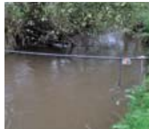
(L-R) PIT tag readers being installed on the River Frome and flat-bed antenna being installed at the salmon counter; PIT tag kit installed on the River Oir.