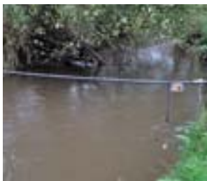
(G-D) Antennes en cours d'installation sur la Frome (photos 1 et 2) et antenne installé sur la rivière Oir (photo 3).