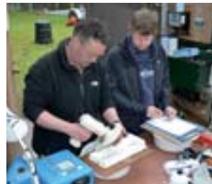
(L-R) Salmon parr are weighed, measured and PIT tagged; 10,000 salmon parr are electro-fished on the River Frome; Smolts are monitored in spring before heading out to sea.